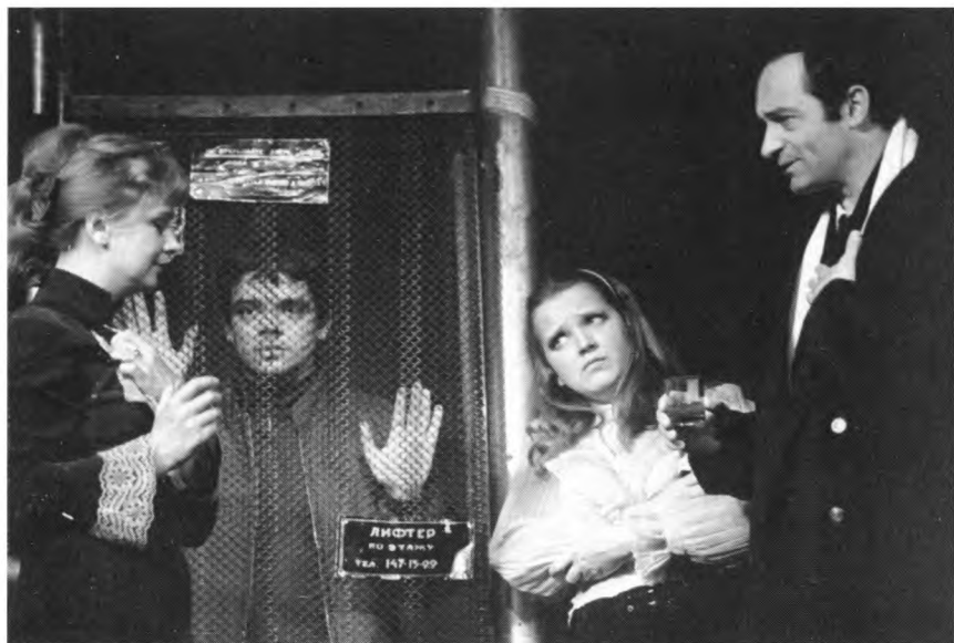
Е. Маркова, К. Райкин, А. Вознесенская, В. Гафт в спектакле «Валентин и Валентина»