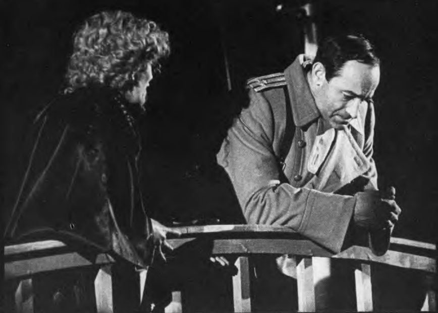
В. Гафт – Вершинин. А.П. Чехов «Три сестры». Сцена на мосту