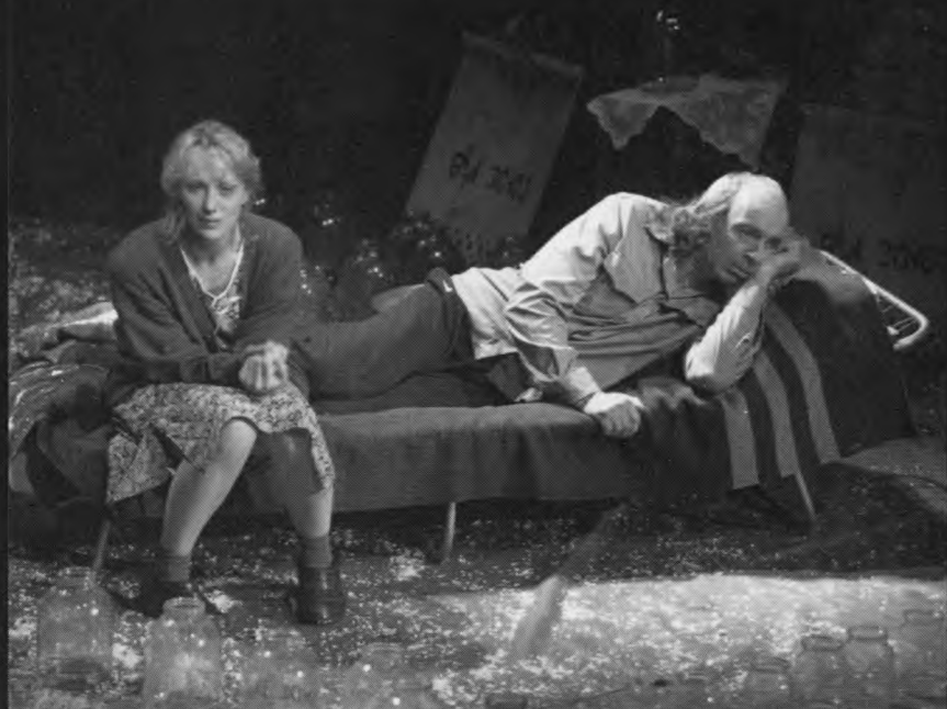
В. Гафт, Е. Яковлева. Н. Коляда «Уйди-уйди». 2000