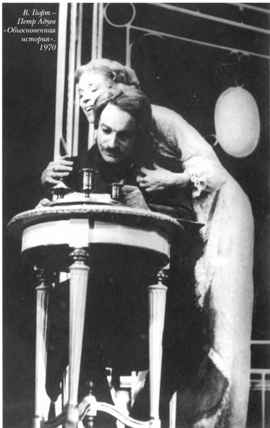
В. Гафт – Петр Адуев «Обыкновенная история». 1970