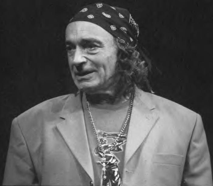
В. Гафт – Валентин, Н. Коляда «Уйди-уйди», 2000