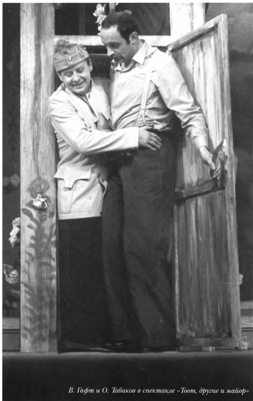
В. Гафт и О. Табаков в спектакле «Тот, другие и майор»