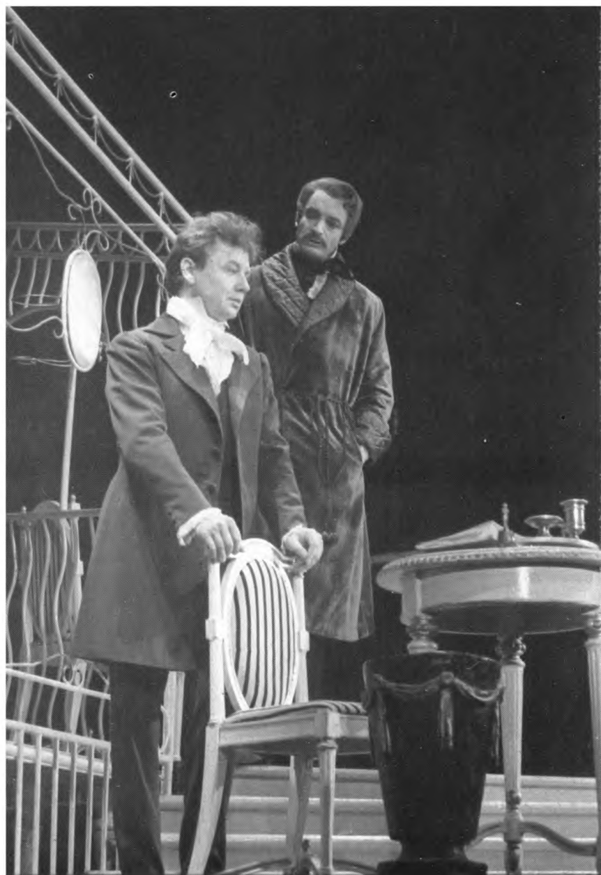
С Олегом Табаковым в спектакле «Обыкновенная история»