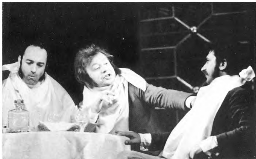
В Гафт – Глумов. С Олегом Табаковым и Игорем Квашой в спектакле «Балалайкин и К°» по М.Е. Салты- кову-Щедрину. 1973