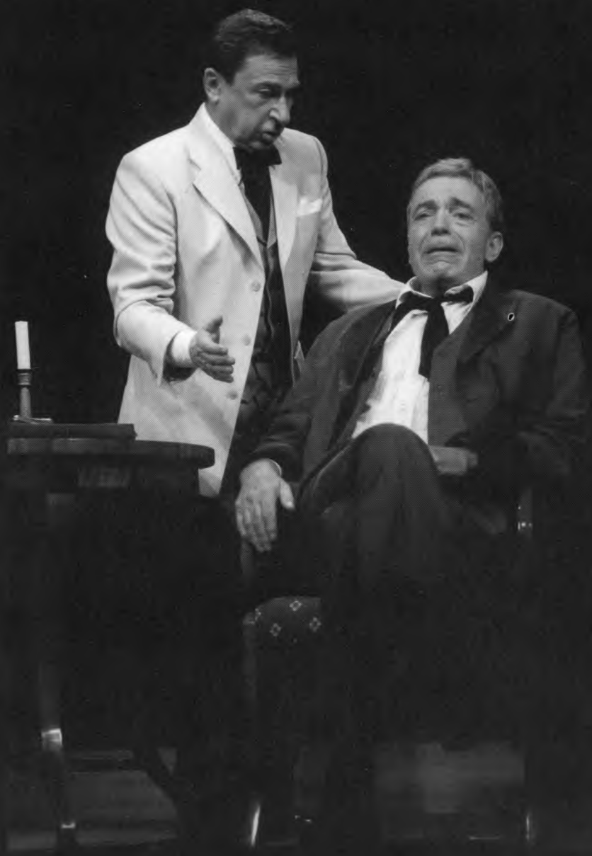
В. Гафт – Глумов. Рассказчик – И. Кваша. М.Е. Салтыков-Щедрин «Балалайки и К°» (возобновление). 2001