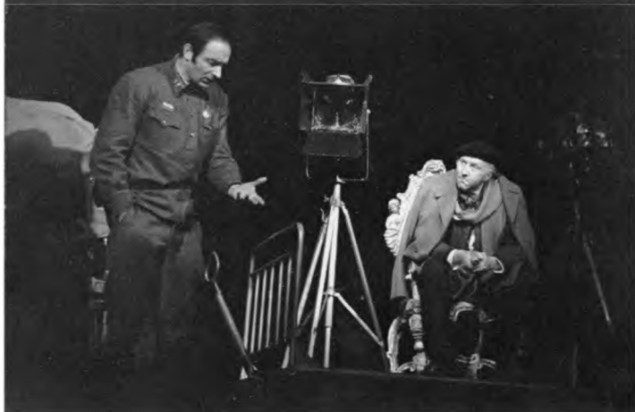
В Гафт – Лопатин. К. Симонов «Из записок Лопатина». 1974