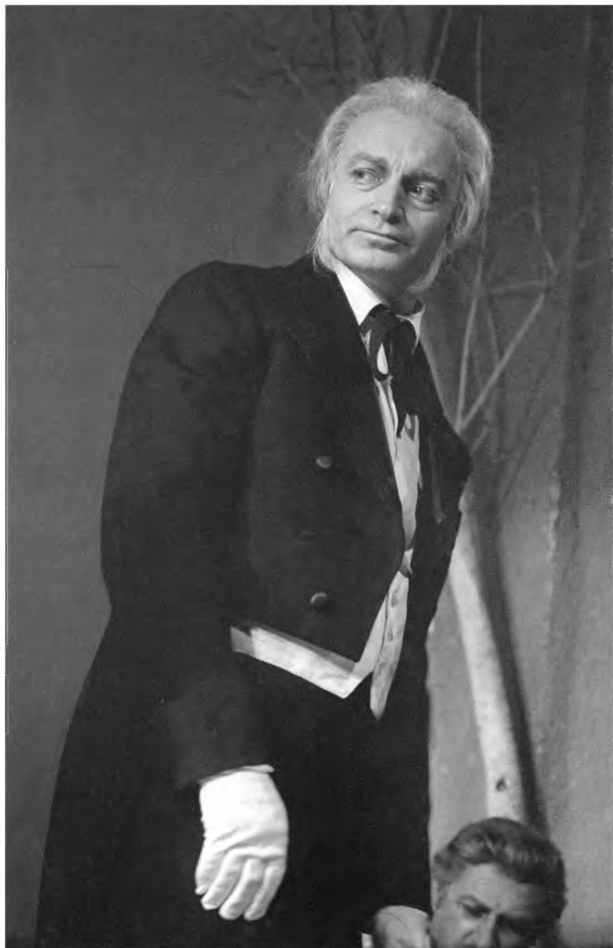
В. Гафт — Фирс. А.П. Чехов «Вишневый сад». 1976