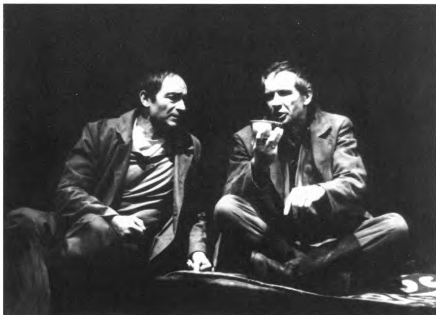
В. Гафт – Сатин. С.Г. Фроловым в спектакле «На дне»