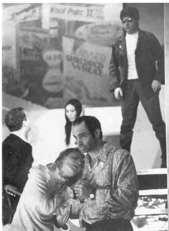
В. Гафт в спектакле «Как брат брату»