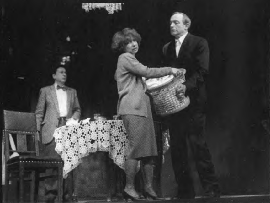
С Лией Ахеджаковой и Игорем Квашой в спектакле «Трудные люди»