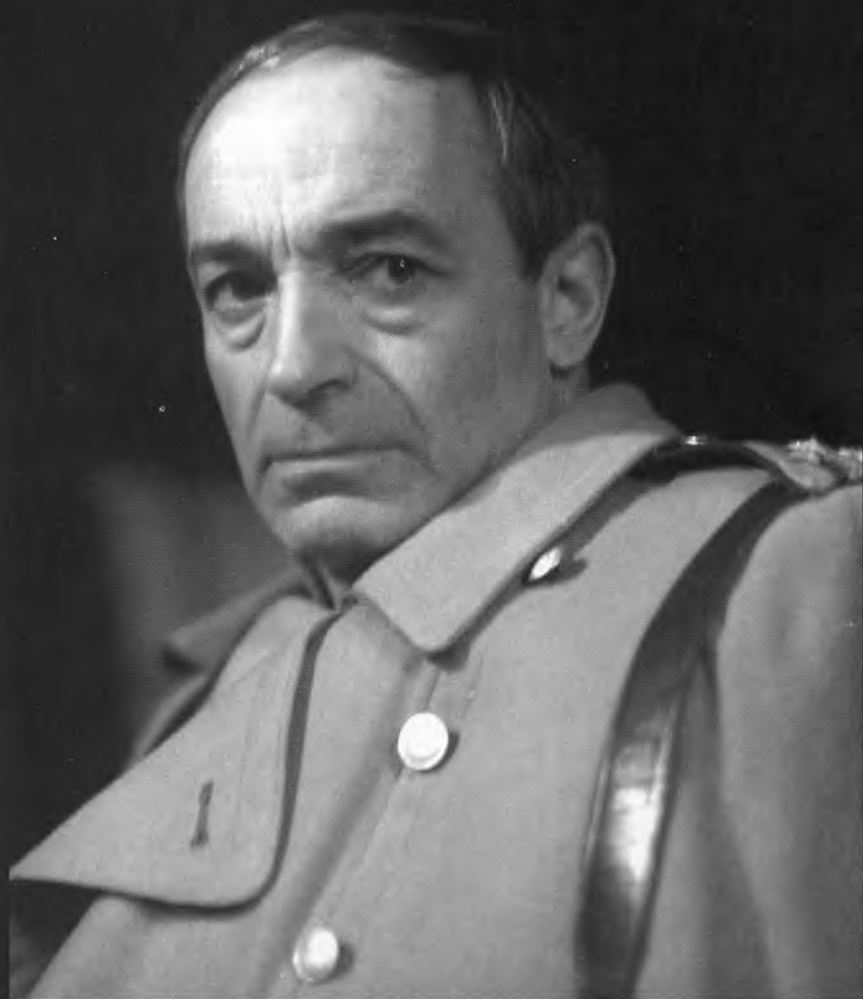
В. Гафт – Вершинин. А.П. Чехов «Три сестры». 1982